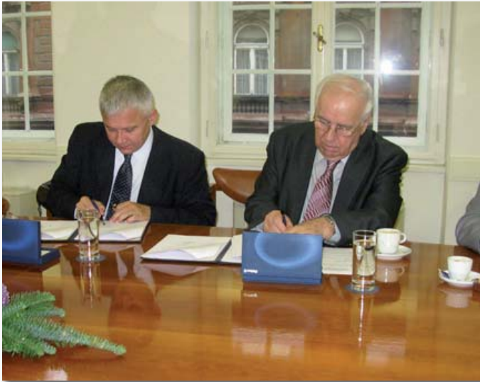
Potpisivanje Sporazuma o suradnji u provedbi aktivnosti iz nadležnosti MK i DGU vezanih za službene prostorne podloge, registraciju posebnih pravnih režima i informatičko povezivanje za razdoblje 2011.-2013.

Ovim Sporazumom o suradnji u provedbi aktivnosti iz nadležnosti MK i DGU utvrđuje se zajednički interes za: izradu i razmjenu prostornih podloga i drugih podataka na području RH za potrebe zaštite prirode, kulturne baštine i krajolika, provedbu pilot-projekta razrade metodologije i registracije režima zaštićenih područja prirode na odabranim pilot-lokacijama (Park šuma Trakošćan, Posebni rezervat prirode i Park prirode Papuk), provedbu pilot-projekta razrade metodologije i registracije režima zaštite kulturne baštine i krajolika na odabranim pilot-lokacijama (Dvorac Drašković s perivojem Trakošćan, Spomenik kulture - stari grad Ružica, Kulturno-povijesna cjelina grada Požege), provedbu pilot-projekta povezivanja informacijskog sustava zaštite prirode Ministarstva kulture, Državnog zavoda za zaštitu prirode i Državne geodetske uprave.