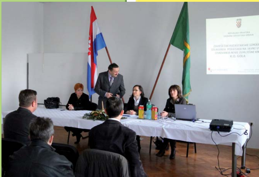
Dovršena katastarska izmjera na području katastarske općine Gola, Koprivničko-križevačka županija