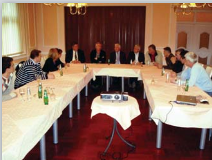
Susret geodetskih uprava

Teme skupa bile su službena kartografija i infrastruktura prostornih podataka. Sve institucije, sudionici skupa - Federalna uprava za geodetske i imovinsko-pravne poslove Federacije Bosne i Hercegovine, Republička uprava za geodetske i imovinsko-pravne poslove Republike Srpske i Državna geodetska uprava Republike Hrvatske - razmjenile su iskustvo i informacije o učinjenom u navednim područjima te iskazale interes za daljnju suradnju u cilju ostvarivanja što boljih rezultata.